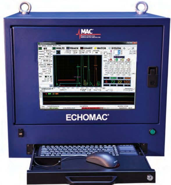
安装于CAB 002温控柜中的Echomac 超声波仪器